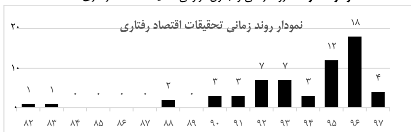
نمودار شماره ۳: روند زمانی و جدول فراوانی تحقیقات اقتصاد رفتاری